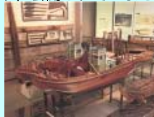
旧いわし博物館の様子