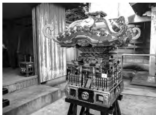
地域住民相互の交流のため