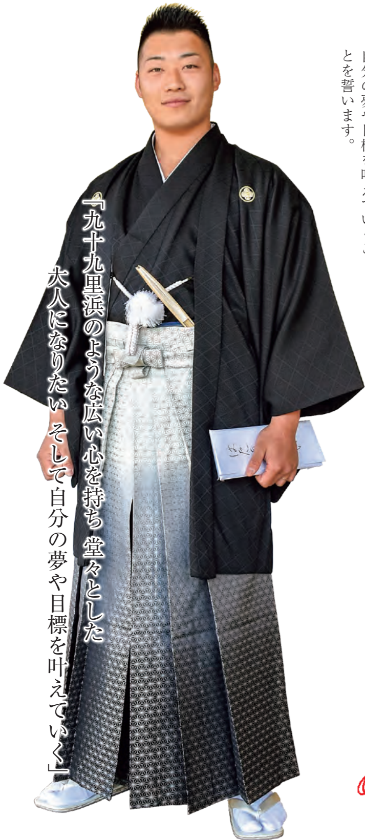
「九十九里浜のような広い心を持ち堂々とした