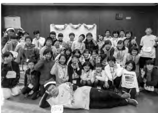
笑顔があふれるクリスマス

町ジュニアリーダーズクラブによるクリスマス会が12月16日、中央公民館で開催され町内の小学校4年生から6年生の児童26人が参加しました。参加した児童たちは、ジュニアリーダーと一緒にミートソーस्पアゲティやシューツリーを作り、昼食には手作りの味に笑みがこぼれていました。午後は、チーム戦でポッチャと輪投げを行い、友達と協力しながら優勝を目指して点数を競い合い、クリスマスの思い出として残る楽しいひとときを過ごしました。