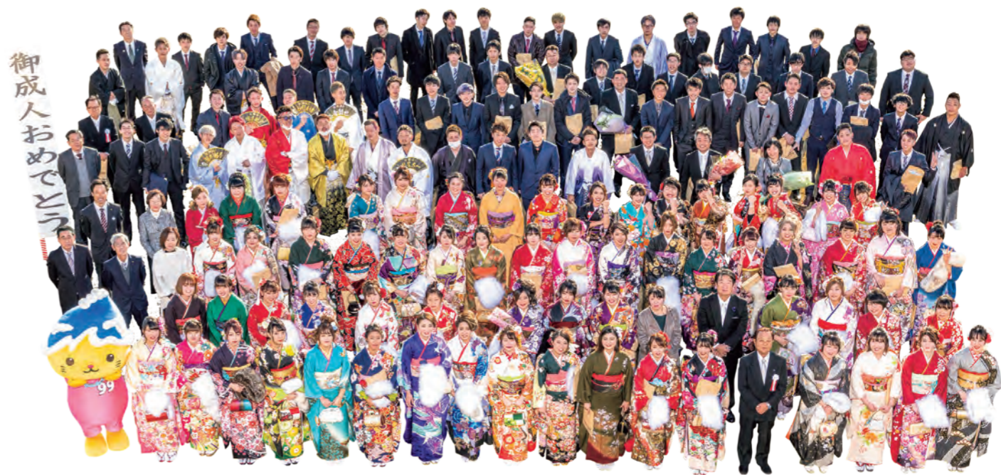
御成人おめでとう