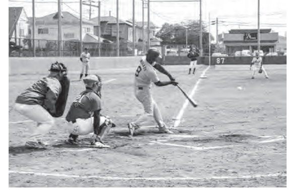
エンジョイベースボール!

とき 3月12日(木)午後7時30 分 ところ 町中央公民館 費用 1チーム当たり、登録費 3,000円、参加費3,50 0円 申込み 参加費を添えて、3月 12日(木)の抽選会時に教育委 員会事務局社会教育係へ ◆大会日程 4月5日(日)・12日(日) ※予備日 4月19日(日)