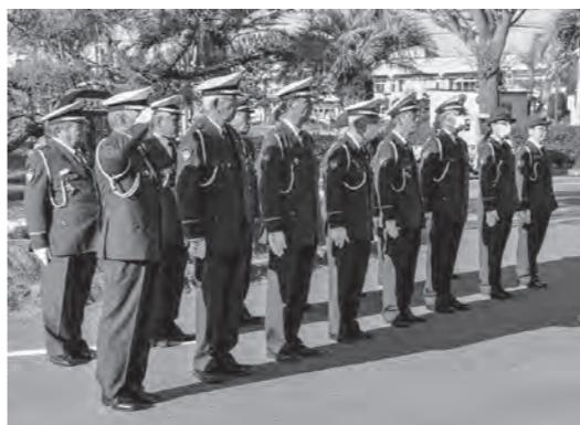
住民の安全と安心を守る

交通安全協会は、交通事故防止のため、交通徳の普及高揚と交通安全の実現に寄与することを目的として設立された団体で、日ごろからさまざまな交通安全活動をおして、私たちの住む町の安全を守るため努力しています。