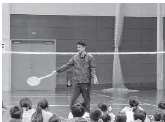
体の使い方の重要性を指導

講師は「体の使い方が分れば誰でも一流になれる」とその大切さについて指導を通して意識付けをしていました。参加者に直接指導した際には、その癖を見抜き、たった5分で改善されていく姿に会場中から驚きの声が上がっていました。