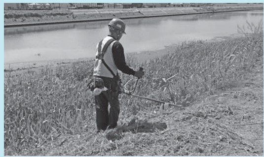
真亀川河川敷の草刈り

ごみの減量化のため、新聞紙・雑誌・ダンボール・古紙・古着などは、できるだけ古紙・古着回収倉庫を活用いただき、リサイクルの一層のご協力を願います。