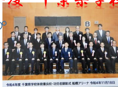
令和4年度 千葉県学校体育優良校・功労者顕彰式 船橋アリーナ 令和4年11月18日