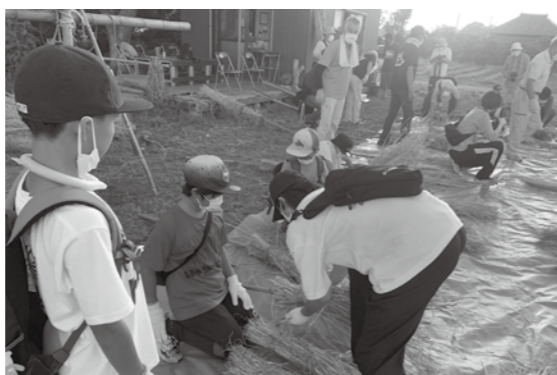
たいまつ作りの様子