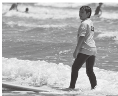
波に乗る子どもたち