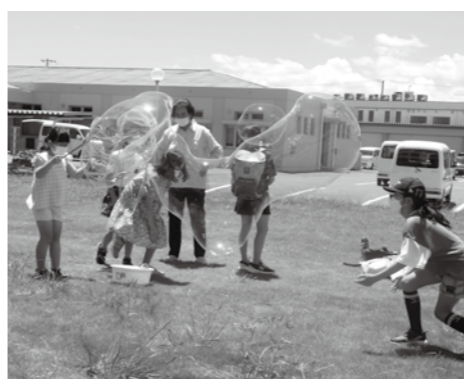
巨大シャボン玉作り体験の風景

短い期間ではありましたが多くの子どもたちが夏休みの宿題を持ち寄り、友達やボランティアの方々と共に、楽しみながら勉強をすることで、意欲的に取り組める環境ができました。最終日には、化学体験としてシャボン玉作り体験を実施し、様々な大きさのシャボン玉作りを楽しみました。みんな、暑さに負けず頑張りました！