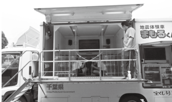
地震体験車「まもるくん」