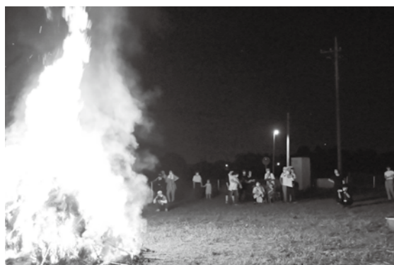
みんなで点火したやぐらが燃える

日が暮れてついに手作りのたいまつに火を灯し、やぐらに点火しました。燃え上がる見事なやぐらを見た子どもたちからは「迫力があって楽しかった」、また保護者からも「参加できて良かった」、「コロナに負けず頑張っていた」との声が上がりました。