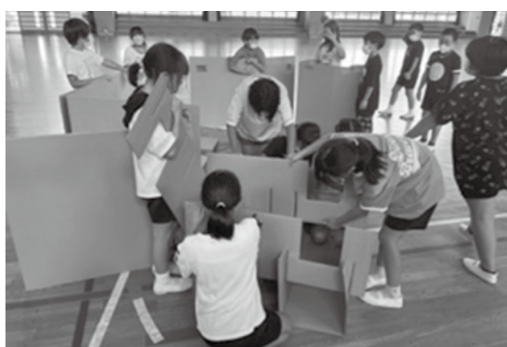
段ボールベッドを組み立てる

最近の台風や津波災害の懸念に対し、小中学校と町で連携し、児童たちが学ぶ時間をとったことは、町では初めての取り組み。これを機に防災意識の向上がより一層進みました。