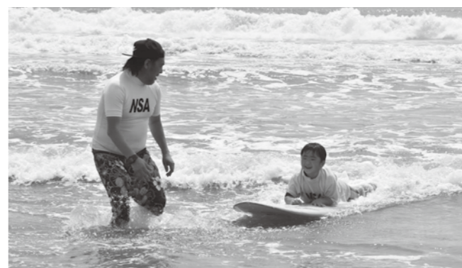
まずは感覚をつかんで