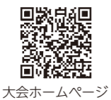
大会ホームページ

詳細については大会ホームページをご覧ください。また、要項・申込書などはお問い合わせいただくか、大会ホームページよりダウンロードしてください。