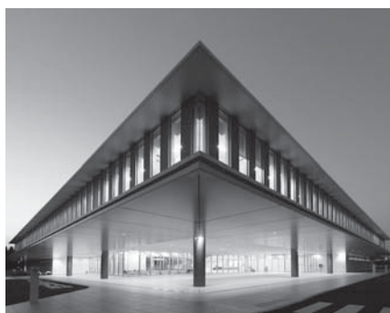
東千葉メディカルセンター

答 【町長】 設立団体として反省すべき点もあり、再発防止策として内部チェックの強化とともに、外部的なチェック体制の再構築も行ってまいります。