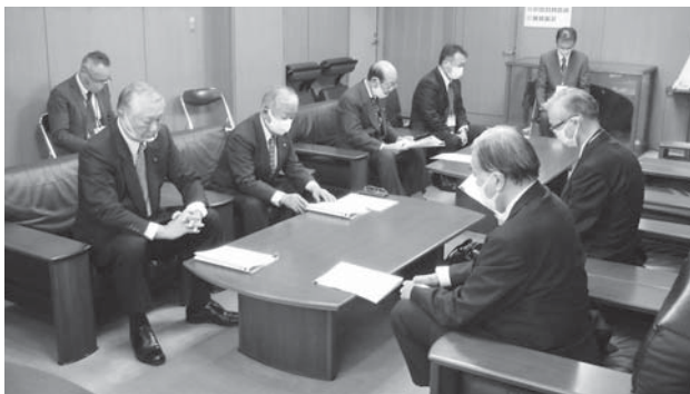
12月10日 東金市役所において

12月10日、東千葉メディカルセンターに意見書、町に要望書などを提出しました。「すべての告発文に対する回答を早急に求める。」などの意見に