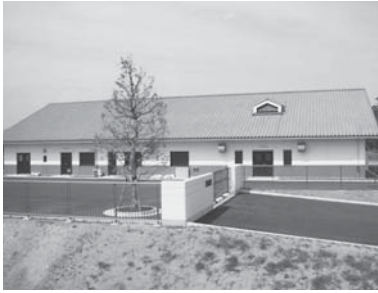
豊海クリーンプラント

〇制定理由 農業集落排水事業の計画的な経営基盤の強化と財政マネジメントの向上などに、さらに的確に取り組むため、令和3年4月から農業集落排水事業を公営企業会計へ移行するにあたり、「九十九里町農業集落排水事業の設置等に関する条例」を制定するものです。 〇施行期日 令和3年4月1日から