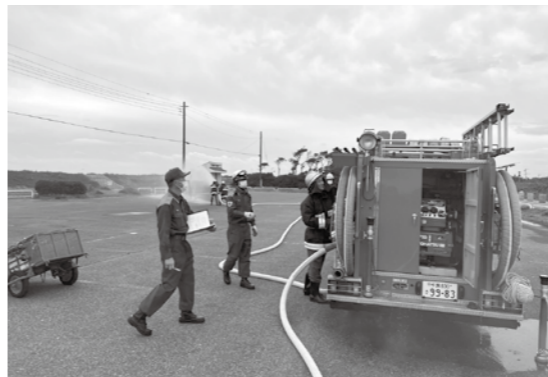
実際の火災を想定して

また、デジタル無線を使用し、各分団同士の情報伝達方法の指導を受けました。参加した団員は、緊張感をもって訓練に取り組み、消防技術の向上を図りました。