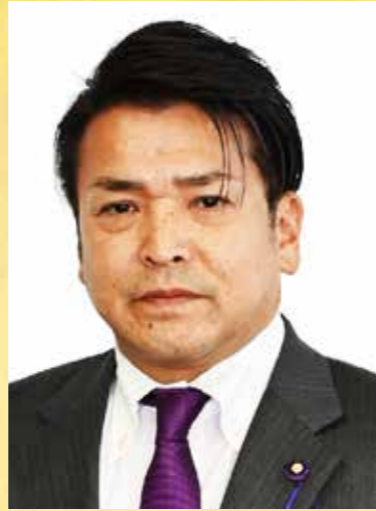
九十九里町議会議員

結びに、町民の皆さまにとりまして、本年が幸多き素晴らしい一年となりますようお祈り申し上げ、新年のご挨拶といたします。