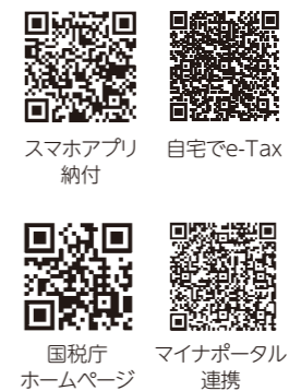
スマホアプリ納付 自宅でe-Tax 国税庁ホームページ マイナポータル連携

控除証明書などの必要書類のデータを申告書へ自動で入力することが出来ます。 ※マイナンバーカード読み取り対応スマートフォンが必要で、詳しくは国税庁ホームページをご確認ください。 納税は「スマホアプリ納付（pay払い）」や「振替納税」が便利です。 詳しくは国税庁ホームページ