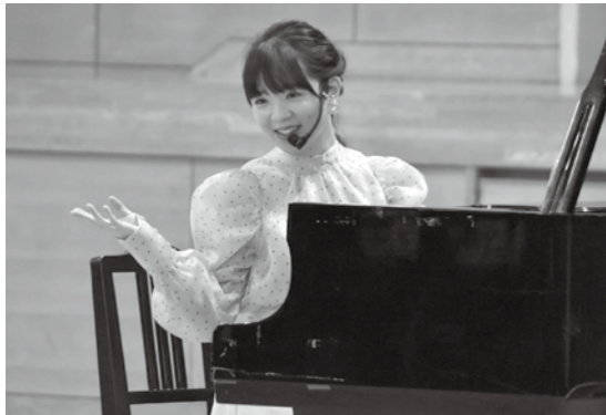
色々な演奏が聴けました

また、物まねピアノ演奏や即興演奏の他、本格的なクラシックピアノ演奏など多岐にわたる演奏を聴くことができました。