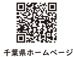
千葉県ホームページ