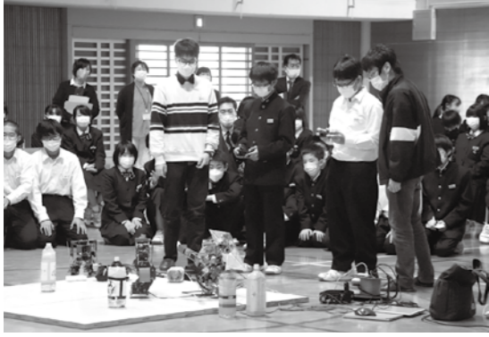
ロボット操作体験の様子

生徒からは「ロボットがどんどん進化し、人々の生活を支えていくようになると思います」と感想があり、未来社会について関心が深まりました。