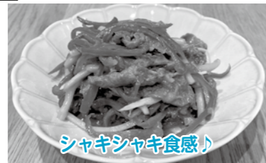
シャキシャキ食感!

市販のもとを使わずに作ってみよう! たけのことピーマンのシャキシャキ感がおいしい♪