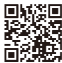
利用可能な保険医療機関について

マイナポータルなどで保険証利用の申し込み(初回登録)を行ったマイナンバーカードを保有医療機関の窓口で提示することで、オンラインによる資格確認を受けることができます。