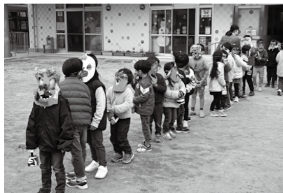
お面を着けて準備完了!

鬼は外福は内 かたかいこども園豆まき 2月3日の節分、かたかいこども園では豆まきが行われました。 園児たちはこの日のために、鬼のお面や帽子など、さまざまなものを作り、鬼を追い払う準備をしていました。園児の中には、去年の豆まきのことを覚えている子も多く、鬼の再来を思うととても怖かったそう。 そんな園児たちの元に、当日は赤鬼が各教室に襲来。「一緒に来るのは誰だ〜！」と鬼が追いかけると、子どもたちは教室の隅まで逃げたり、恐怖のあまり泣き出したり、鬼に捕まった子を手助けするために手作りの新聞紙製の豆を果敢に投げて応戦したり。鬼は各教室の園児たちに「鬼は外！」で追い払われ最後は園庭に。 教室の窓から他の園児たちが見守る中、園庭では年長児たちが鬼に立ち向かい、勇気を振り絞って一生懸命豆を投げて鬼を追い払いました。 園児たちは鬼がいなくなった後「やったー！」と喜んでいました。 今年も良い年になりますように。