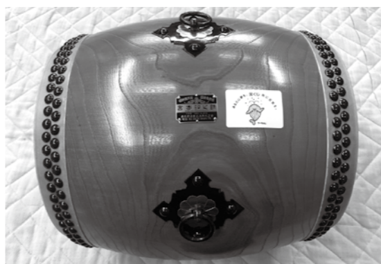
受け継がれるふるさとの伝統

文化の継承 夢まるふぁんど文化(国際)支援事業 12月14日、町中央公民館にて、夢まるふぁんど文化(国際)支援事業の贈呈式が行われました。 この事業は、県内を中心に伝統的な民俗芸能や民俗技術、歴史的文化的の保存・伝承および国際交流事業を行っている団体・組織を支援する助成事業で、多数の応募の中から審査の結果、九十九里黒潮太鼓に助成されることとなりました。 助成を受けて、無形民俗文化財を保存・継承するため、演奏で使用する笛など楽器類の整備を行います。