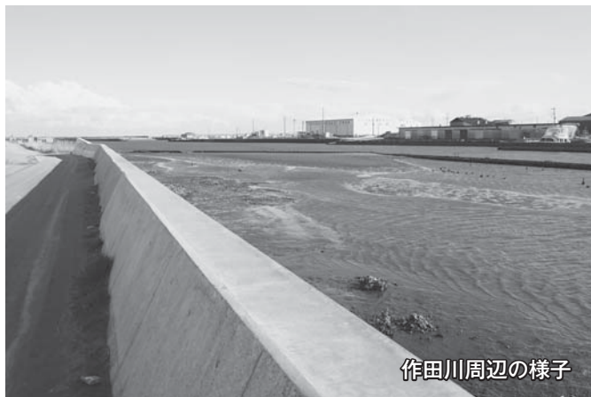
作田川周辺の様子

につきましては、片貝漁港区域に整備される防護施設の高さについて、要望したところでございます。