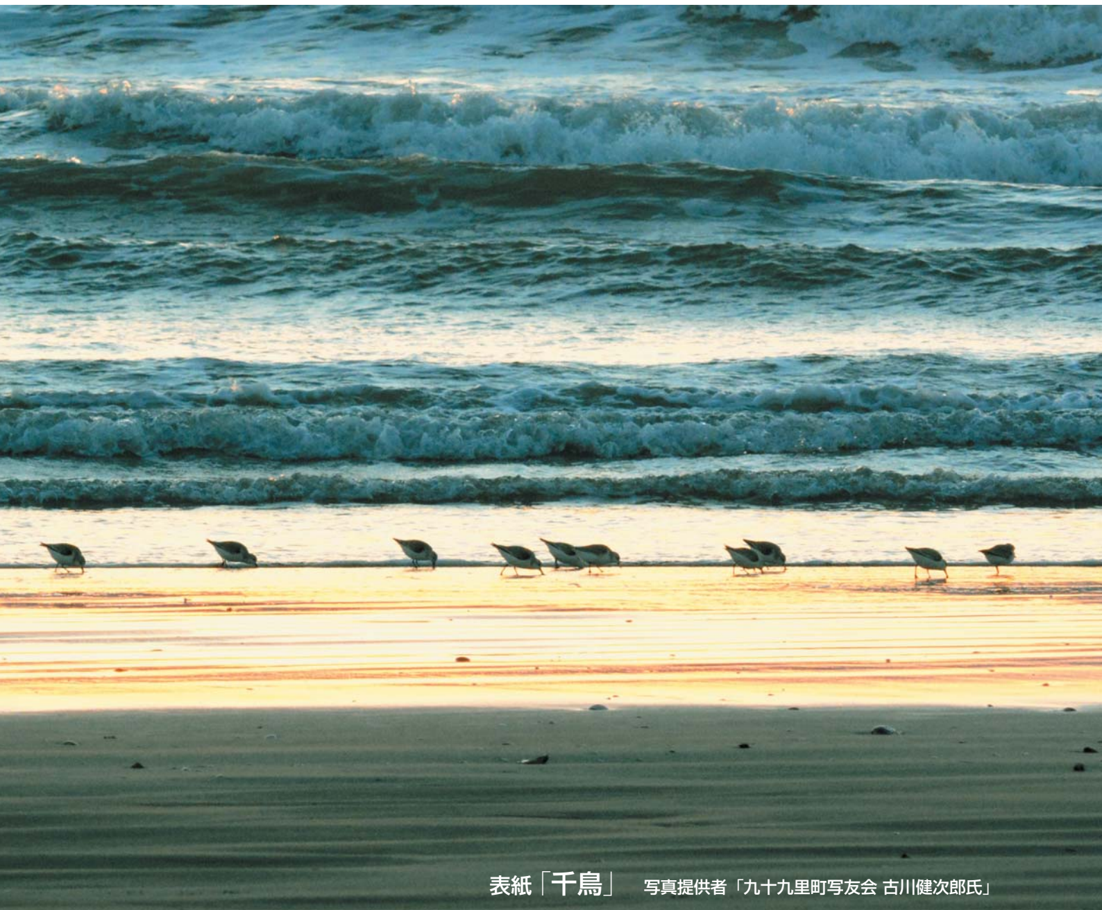
表紙「千鳥」