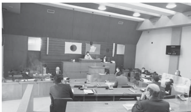
※今回は、コロナ対策のため議場で行われました。