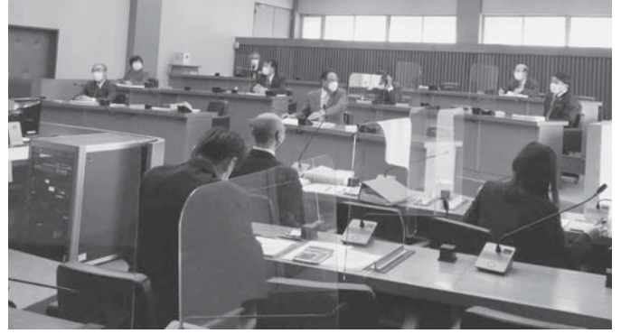
▲常任委員会での質疑の様子