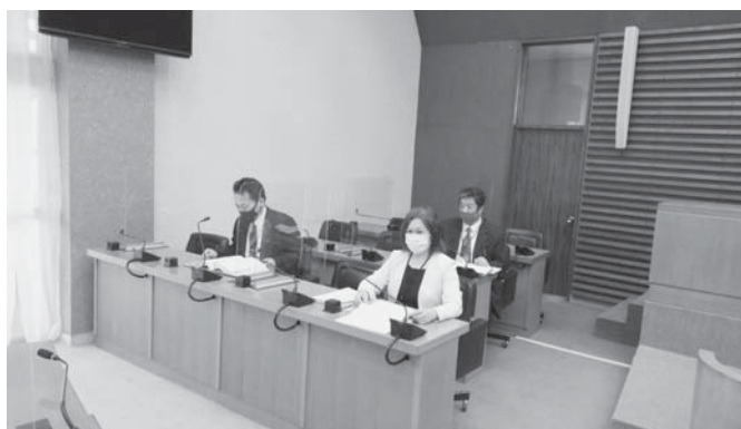
▲常任委員会で町側が質問を受けている様子