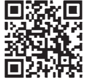
アンケートフォーム

◆注意点 ・回答は1人1回限りとなります。 ・回答の途中で、回答状況を一時的に保存することはできません。 ・選択式の設問は該当する選択肢をチェックしてください。 ・また、記述式の設問は可能な限り具体的に回答ください。