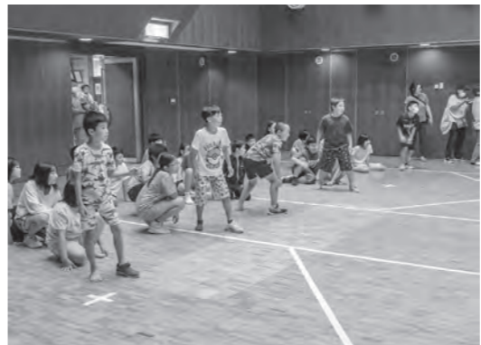
みんなで楽しくレク大会

6月21日から24日までの4日間、町内の小学4年生から6年生を対象とした通学合宿が4年ぶりに実施されました。 通学合宿は、3泊4日家族と離れて友達と共同生活をするこゝとで、自主性や協調性を養い、生活力を高めることを目的とした宿泊体験合宿です。 町の子ども会育成連絡協議会、青少年相談員連絡協議会、食生活改善会、ジュニアリーダーズクラブ、町内の各小学校およびPTA、その他ボランティアなどたくさんの方の協力により久しぶりに実施されました。 今回は総勢31人の子どもたちが参加し、合宿の中で朝食や夕食の準備、清掃や就寝準備など、家庭生活で必要になることを自分たちで協力して過ごしました。 また、ボッチャやジュニアリーダーズクラブによるレク大会なども行い、楽しい時間を過ごしました。 子どもたちからは、「みんなで作ったご飯はとってもおいしかった」「新しい友達ができた」「協力する大切さを学んだ」などの声が上がりました。