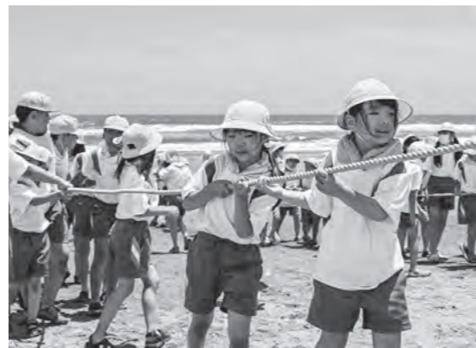
最後まで頑張って引きました

6月16日、豊海小学校の児童が真亀海岸で地引き網体験をしました。 左右両側に分かれて一生懸命に網を引き、段々と網が手繰り寄せられる感覚にワクワクしながら、力いっぱい最後まで頑張りました。 捕れた魚はアジやサバなどの他、サメやエイ、カニやクロダイもいて、児童たちは魚を恐る恐る触ったりして、楽しい時間を過ごしました。 最後は捕れた魚をみんなでおいしくいただき、満面の笑みがこぼれていました。