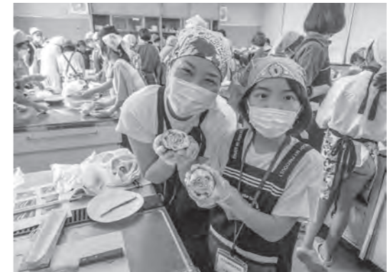
おいしくできました!