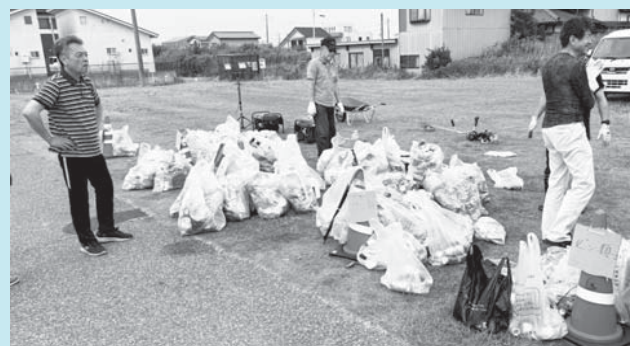
ご協力ありがとうございました