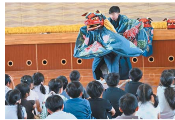
目、耳、肌で感じる伝統芸能

古くから大切にされてきた人々の願いや、伝統をつないでいくことの大切さを学ぶ体験となりました。