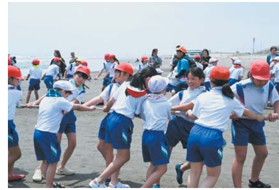
力を合わせて頑張りました