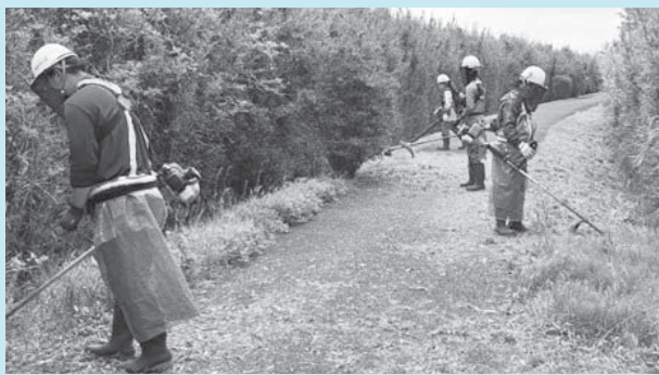
真亀川河川敷の草刈り