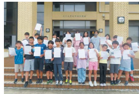
新しい友達もできました

夕食は、食材を買いに行き、自分たちで野菜を切ったり盛り付けたり。出来上がった煮込みハンバーグやカレーライスを食べ、片付けまで頑張りました。また、ジュニアリーダーズクラブによるレク大会もあり、楽しい3日間を過ごしました。